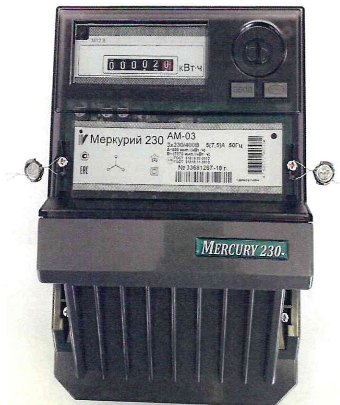
Рисунок 1 – Общий вид счетчиков с закрытой клеммной крышкой

Общий вид счетчиков представлен на рисунке 1. Схема пломбировки от несанкционированного доступа, обозначение места нанесения знака поверки представлены на рисунке 2.