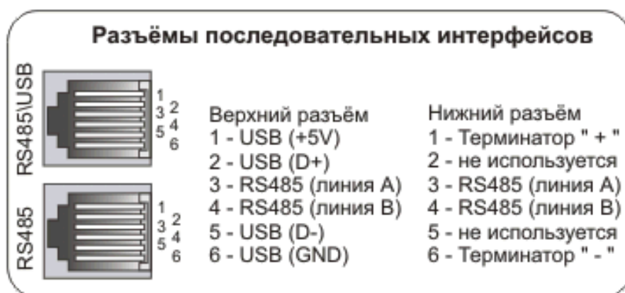
Рисунок 11.2 – Назначение контактов разъемов