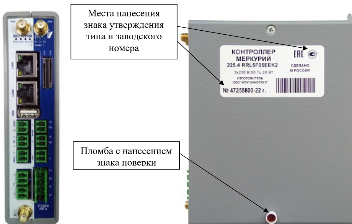
а) передняя панель контроллеров

Общий вид контроллеров с указанием места ограничения доступа к местам настройки (регулировки) и мест нанесения знака утверждения типа и заводского номера представлен на рисунке 1. Способ ограничения доступа к местам настройки (регулировки) – пломбирование.