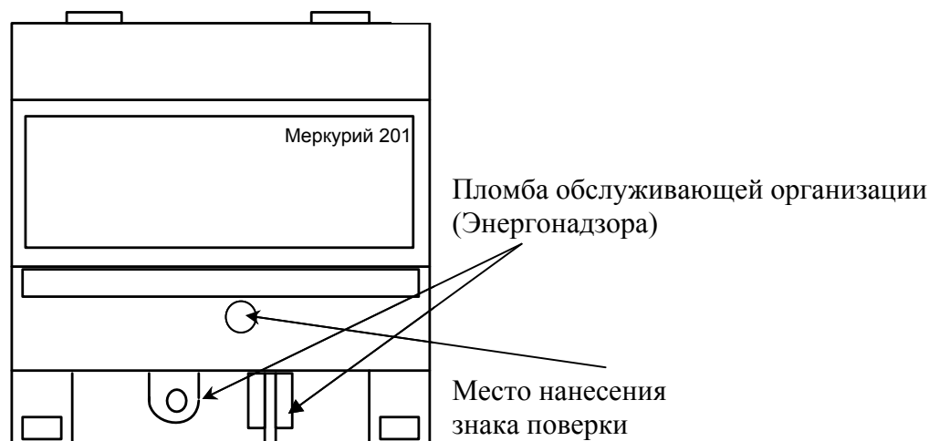
Рисунок 6 - Схема пломбировки от несанкционированного доступа, обозначение места нанесения знака поверки счётчиков «Меркурий 201.1», «Меркурий 201.2», «Меркурий 201.22», «Меркурий 201.3», «Меркурий 201.4», «Меркурий 201.42», «Меркурий 201.5», «Меркурий 201.6»