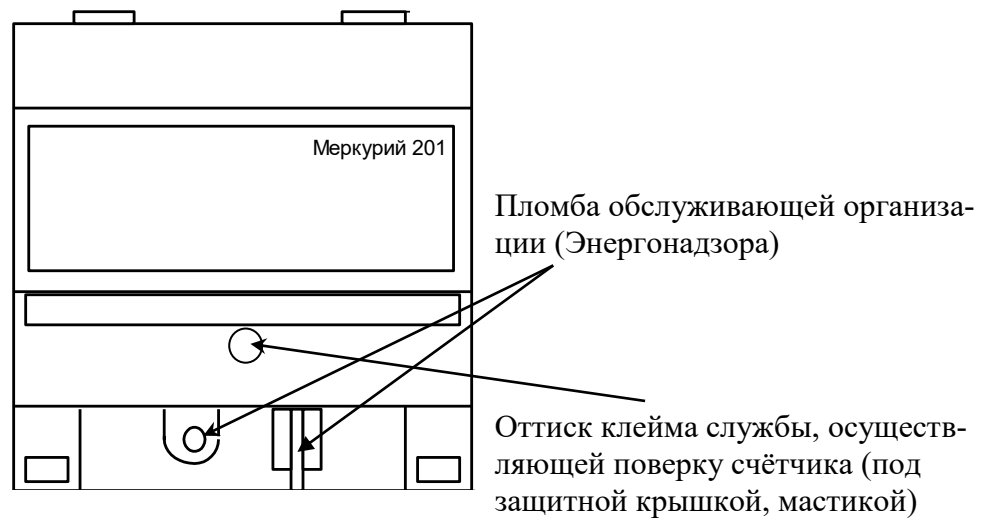
Рисунок 6 - Схема пломбирования счётчиков «Меркурий 201.1», «Меркурий 201.2», «Меркурий 201.22», «Меркурий 201.3», «Меркурий 201.4», «Меркурий 201.42», «Меркурий 201.5», «Меркурий 201.6»