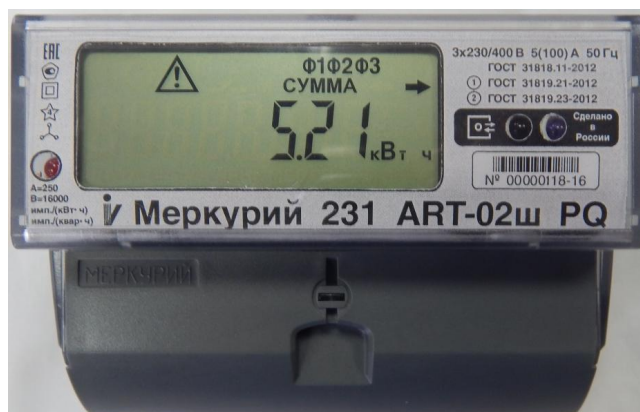
Рисунок 5 - Общий вид счетчика электрической энергии статического трехфазного «Меркурий 231А(Р)Т-0Хш»

Схемы пломбировки от несанкционированного доступа, обозначение места нанесения знака поверки знака поверки представлены на рисунке 6.