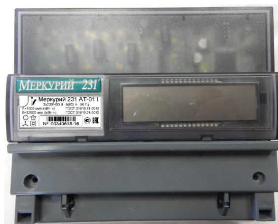
Рисунок 4 - Общий вида счетчика электрической энергии трехфазного статического «Меркурий 231А(Р)(Т)-0Х»

Общий вида счетчика электрической энергии трехфазного статического «Меркурий 231А(Р)(Т)-0Х» представлен на рисунке 4.