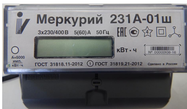
Рисунок 3 - Общий вида счетчика электрической энергии трехфазного статического «Меркурий 231А-0Хш»

Общий вида счетчика электрической энергии трехфазного статического «Меркурий 231А-0Хш» представлен на рисунке 3.